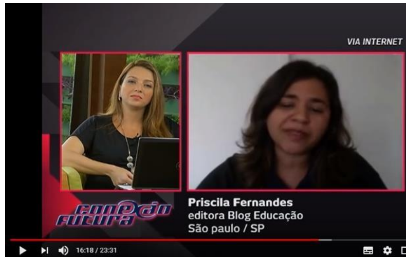
Figura 1 – Imagem ilustrativa referente aos critérios de polaridades