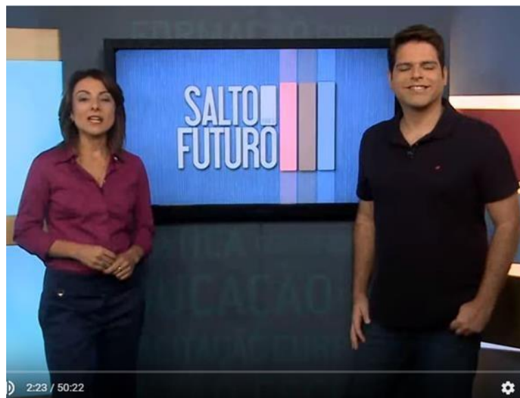
Figura 2 – Exemplo de elemento centralizado no canal TV Escola

No vídeo do canal TV Escola, conforme a Figura 2, o autor/produtor articulou recursos semióticos, como imagens em movimento e com texto oral. Utilizando os subsistemas de polaridade de esquerda e direita retratando informações dadas e informações novas, e também, com elemento centralizado indicando um valor informativo maior ou mais importante em relação a imagem.