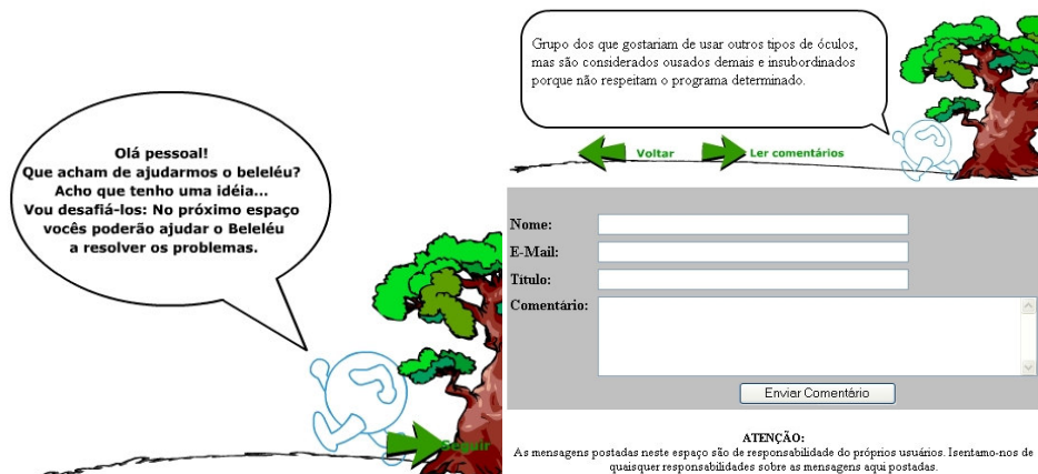
Figura 3 – Convite para Registrar suas Propostas

Ao escolher um dos problemas, o aluno é convidado pelo Pito a registrar suas soluções, ler e comentar as reflexões registradas pelos colegas, conforme figura 3.