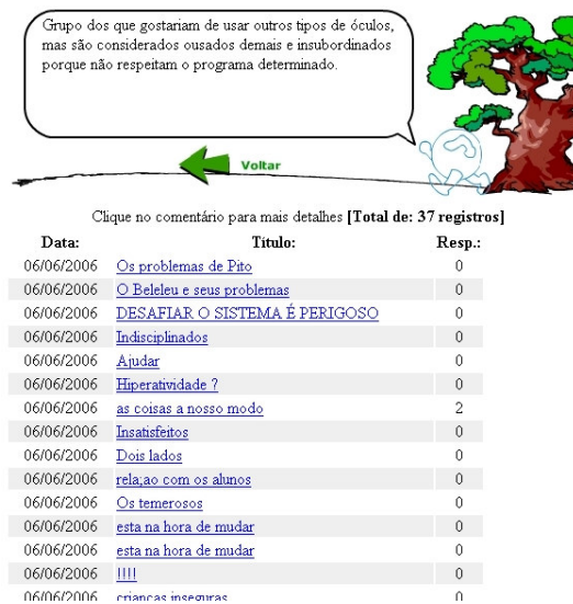
Figura 4 – Registros no Fórum de Discussão

No desenvolvimento desta ferramenta utilizamos a linguagem ActionScript na realização das animações. Na implementação do fórum adaptamos um script PHP desenvolvido por Lauro Assis Lima de Brito, o qual se encontra disponível: www.phpbrasil.com além do banco de dados MySQL.