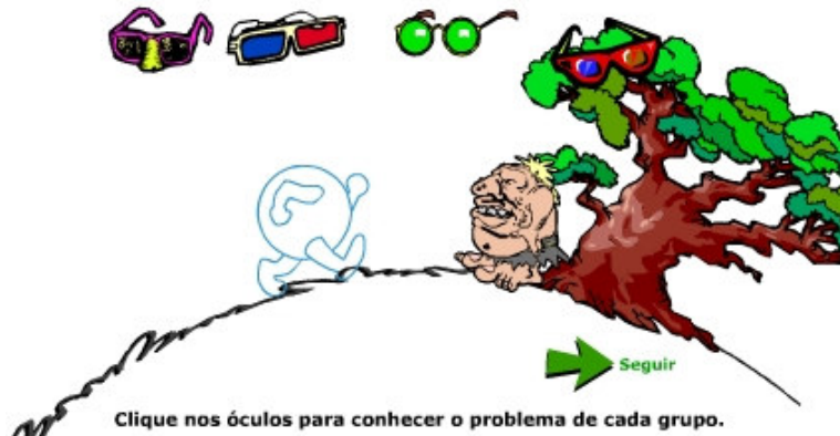
Figura 2 – Tipos de Óculos

A seguir são apresentados quatro tipos de óculos especiais, cada qual com disfunção específica, sendo que referem-se a problemas apresentados na história definida pelo professor.