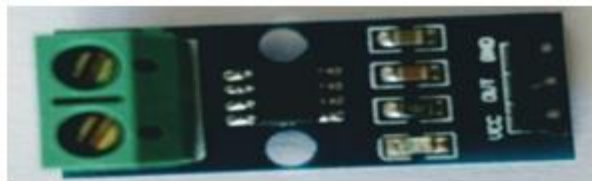
Figura 4. Módulo Sensor de Corrente ACS712

O sensor de corrente ACS712 é um sensor de pequena dimensão e invasivo para baixas e médias correntes. Apresenta boa sensibilidade para medição, além de ser capaz de medir corrente alternada e contínua. É um sensor de efeito Hall que gera uma saída de tensão proporcional a corrente que flui entre os pinos IP+ e IP- do sensor. Por ser um sensor invasivo é necessário fazer a interrupção do circuito, a Figura 4 apresenta o sistema: