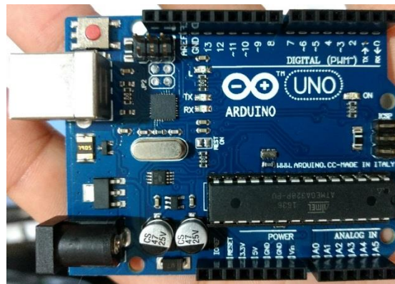
Figura 3. Arduino Uno

A Figura 3 mostra o arduino uno R3 o qual foi aplicado no projeto e atende as especificações de monitoramento da energia, pois apresenta as portas adequadas de forma a fazer a ligação no sensor de corrente.