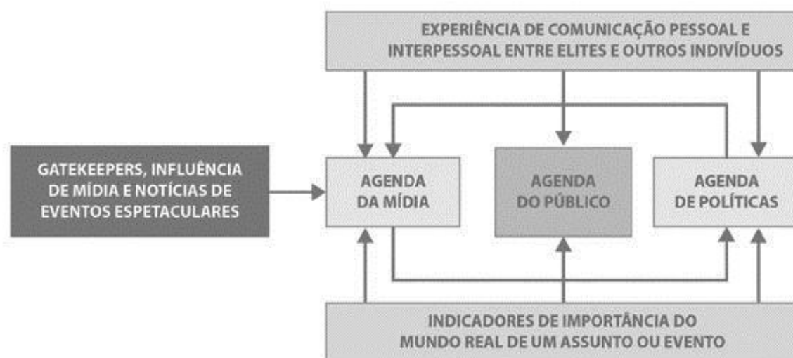
Figura 1: Os principais componentes do processo de agendamento: agenda de mídia, agenda do público e agenda de políticas. Fonte: Dearing; Rogers (1996).

Tentar compreender quais assuntos são selecionados, preteridos, enfatizados ou ignorados é o objetivo da análise da agenda dos meios de comunicação. A forma de testar e medir o Agendamento, como já dito, é tradicionalmente uma combinação de análise de conteúdo e aplicação de questionários. Nesses questionários, ou pesquisas de opinião, geralmente se verifica o posicionamento dos sujeitos diante de um determinado problema (Gallup Poll) ou se pede para elencar quais os temas públicos considerados de maior importância em um dado momento. Por último, a agenda de políticas é mensurada por ações políticas relacionadas a decisões legislativas, ordem executiva, criações de instrumentos legais ou algo que represente uma resposta efetiva dos gestores públicos (DEARING; ROGERS, 1996).