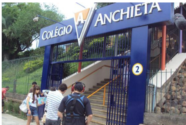
Figura 3: Ação de merchandising do Colégio Anchieta no seriado

evidencia-se na série uma ação de merchandising do Colégio Anchieta, no qual a protagonista do seriado e seus amigos estudam.