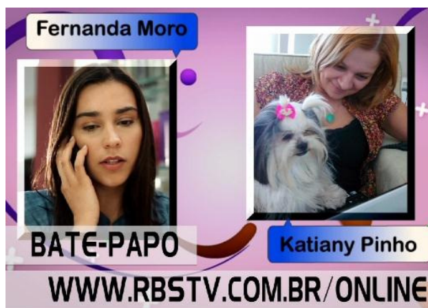
Figura 5: Divulgação durante o programa do bate-papo on-line que acontecerá após o episódio

Além das estratégias acima citadas, após cada programa é realizado um chat – bate-papo on-line – entre dois dos atores ou produtores e os telespectadores. Além disso, Bianca – a personagem principal de On line -, escreve posts no seu blog, produz conteúdo como em um diário de adolescente, contando sobre a sua relação amorosa com um dos personagens, amigas da escola, postando imagens das gravações e interagindo com os ‘internautas-telespectadores’, na medida em que os incentiva a enviar mensagens e assistir ao programa (Figura 6).