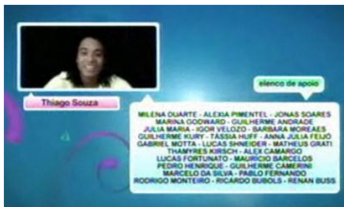
Figura 4: Tela de créditos da edição do programa

Como forma de composição do cenário, nos momentos de acesso à internet feito pela protagonista, a figura do computador é reforçada, além do efeito de imagem gerado na TV, como se a filmagem estivesse sendo realizada a partir da webcam da personagem.