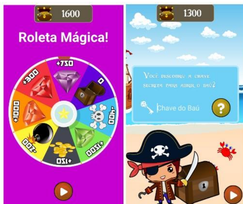
Figura 2 - Tela do subjogo “Roleta Mágica”(à esquerda) e Tela de adivinhação do “Baú Secreto” (à direita)

Apesar de haver um botão de ajuda (representado pelo símbolo de interrogação “?”) com função de revelar todas as dicas acumuladas no jogo para caso de a criança não se recordar, parte considerável das crianças pediram ajuda diretamente aos pesquisadores. Provavelmente isso ocorreu devido a dificuldade de leitura por parte das crianças, ainda em processo de alfabetização; assim, parte algumas delas não entenderam o propósito das dicas no jogo e, ao atingir a tela que perguntava o objeto referente às dicas, essas crianças solicitaram ajuda.