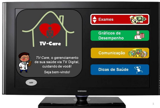
Figura 2 - Menu principal do TV-Care

A interface de interação com a televisão provê diversas possibilidades ao idoso, como as “Dicas de Saúde”, que atualmente consistem em aproximadamente 150 vídeos. Além disso, ele pode verificar seus “Gráficos de Desempenho” ao longo do tempo, percebendo a variação do estado dos seus sinais vitais. O sistema foi pensado para atender principalmente ao público da terceira idade, por isso a interação do usuário com a aplicação deve ser simples e pode ocorrer através do controle remoto da TV. A Figura 2 mostra a tela inicial do TV-Care.