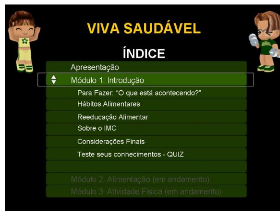
Figura 3 - Menu principal do aplicativo de EAD

A interface do índice é apresentada na Figura 3, e pode-se observar as diversas lições implementadas no curso, inclusive atividades “para fazer” e questionários para testar o conhecimento do aluno.