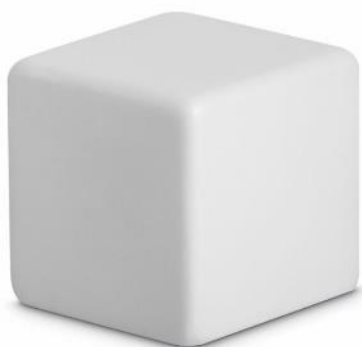
Figura 1 – El cubo blanco

A continuación contábamos historias con unos dados que tienen dibujos en sus caras 7 . Consiste en tirar los dados y en función del orden y el dibujo construir una historia. De este modo se trabaja la creatividad. A partir de la imagen se genera la historia. “El más acá y el más allá repiten sordamente la dialéctica de lo de dentro y de lo de fuera: todo se dibuja, incluso lo infinito” 8 . Aunque siempre sean los mismos