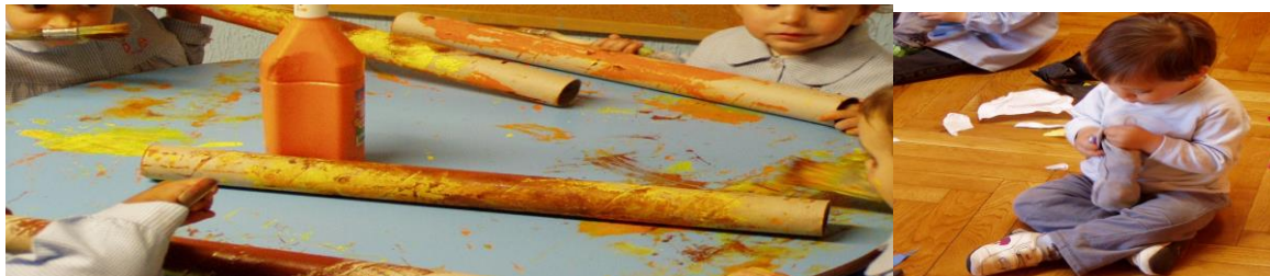
Figuras 1 y 2 – Niños pintando los rollos y poniendo papel amasado en un calcetín

aunque los niños sí participaron más del proceso de elaboración, teniendo más tiempo para realizar la actividad.