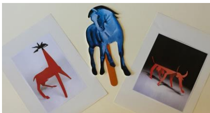
Figura 4 – Marioneta de caballo azul y obras de Alexander Calder

Es importante seleccionar las partes del cuento que servirán de gancho, dado que la actividad redonda en la participación activa de los niños, y no en contar un cuento. Hay que elegir las paginas mas significativas para poder enlazar con el tema del taller, y en esta ocasión también se enseñaron imágenes de animales de diferentes artistas.