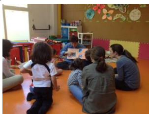
Figura 5 – Contando el cuento