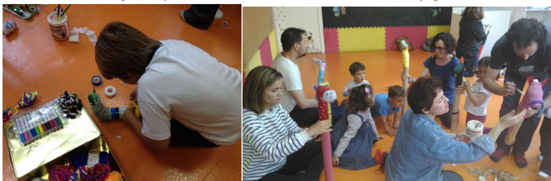
Figura 7 y 8 – Personalizando sus esculturas de jugar