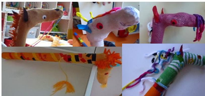
Figura 9 – Enseñando las animales de jugar terminadas

Cuarta y última sesión. Cada grupo exponía su creación, y fueron aplaudidas y comentadas. Para terminar, los niños tuvieron que dibujar su animal.