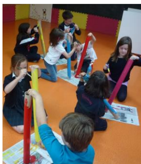
Figura 6 – Pintando los rollos de cartón

Tras la introducción del tema llega el momento de pintar los rollos de cartón con el color que eligen los niños. Cada grupo tiene su ritmo, y según la edad de los niños se muestran más o menos imágenes, y se ofrecen más o menos materiales. En los grupos de los pequeños y medianos, los niños son ayudados por los padres. Los mayores suelen trabajar de forma autónoma, y las responsables del taller son las que proporcionan ayuda, cuando se pide.