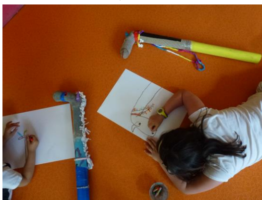
Figura 10 – Diseñando, de tres dimensiones a dos

Proponer que dibujen en dos dimensiones algo que han construido en tres es siempre un desafío. Hay que avisar a los niños y padres que es difícil -que a nosotros también nos cuesta- pero que lo intenten, porque lo que salga estará bien. Los resultados siempre sorprenden a todos. Representan detalles en los que antes no nos habíamos fijado, y los niños mismos ven sus creaciones de otra manera.