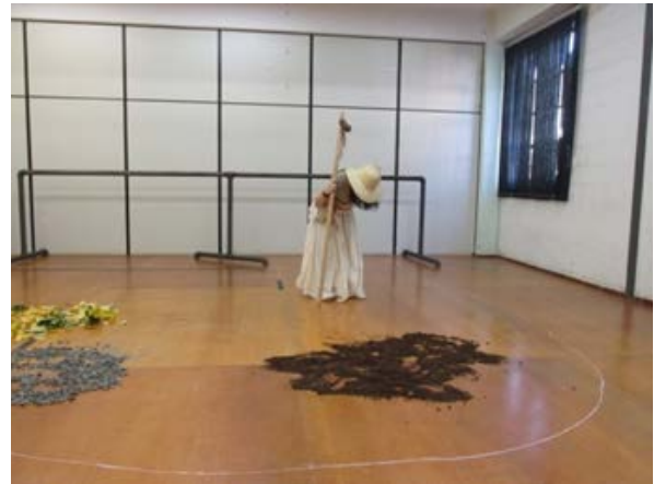
Fig.1 : Intérprete em laboratório dirigido (2014)

Foi dessa maneira que nasceu o espetáculo Sertões de Dentro . Nele, elementos de diferentes tempos e espaços absorvidos e vividos pelo e no corpo foram escavados e transformados em movimentos, sensações, emoções e imagens, culminando no desabrochar de algo novo, porém impregnado das experiências do campo e, claro, de vida, num fluxo intenso que flui de dentro para fora. Nesse momento, o papel da direção é fundamental, pois possibilita a seleção dos conteúdos e a efetiva elaboração do roteiro.