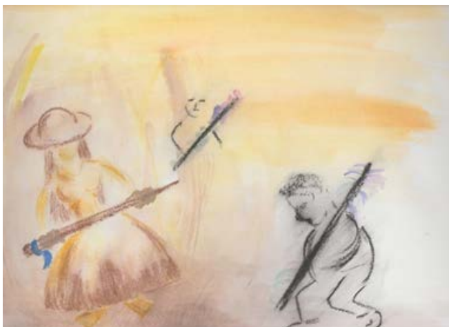
Figura IV: aquarela feita pela intérprete ao longo do processo criativo, Salomé brinca e luta (2014)

Esse momento, caracterizado pela seleção e agrupamento dos conteúdos que seriam apresentados no roteiro, foi pontuado por uma forte ansiedade. Mesmo a incorporação da personagem, já um tanto orgânica, tornou-se difícil. Mais uma vez, a atuação constante da direção fez com que fosse possível, para mim, perceber esse sentimento e tentar, assim,