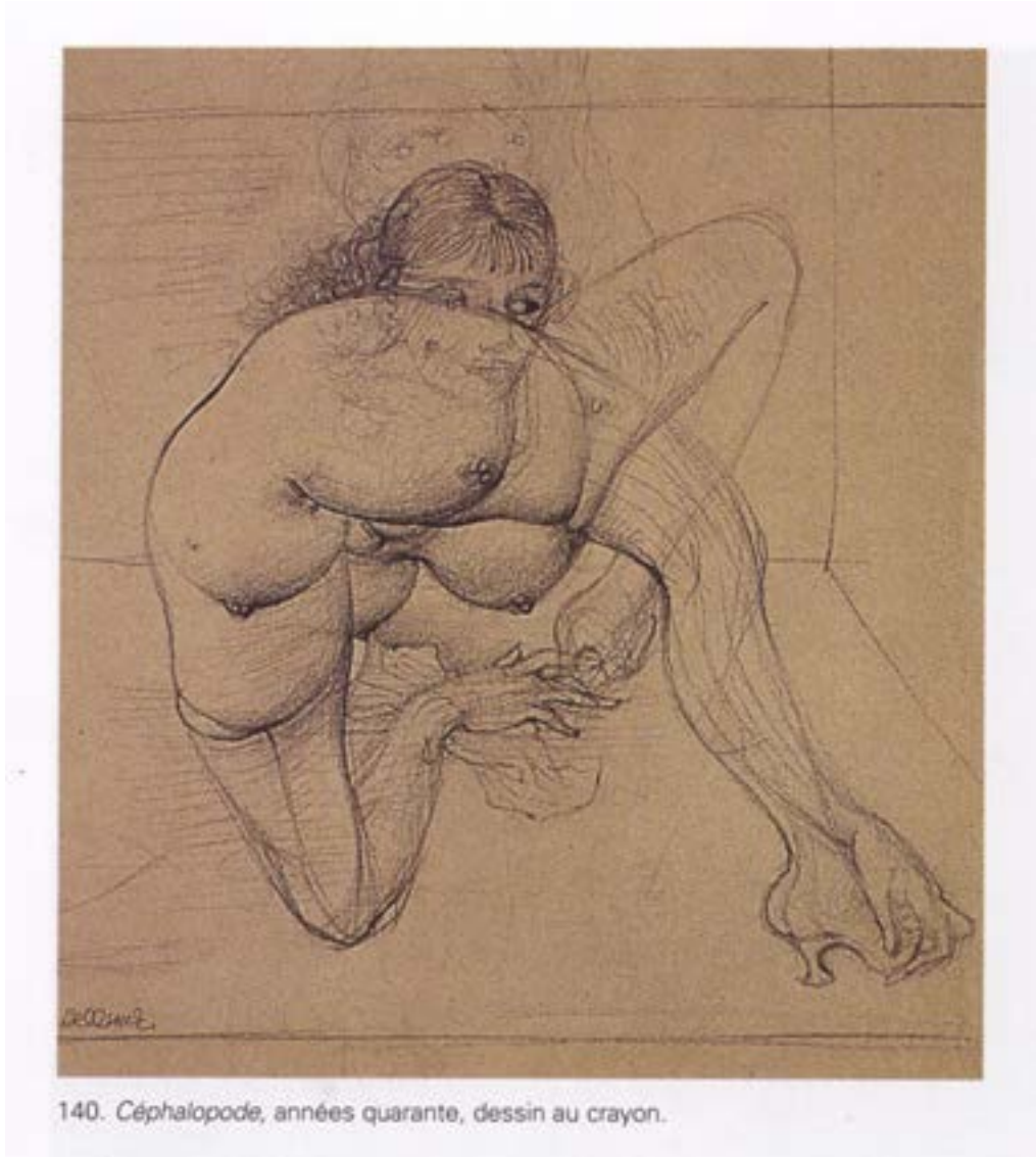
140. Céphalopode, années quarante, dessin au crayon.

público é posicionado em torno deste círculo bem próximo ao espaço dos bailarinos. O terceiro círculo exterior é formado por oito alto-falantes que fazem parte do sistema de som espacializado e engloba todo o espaço da performance. Localizado entre os alto-falantes e a arena/espaço dos bailarinos, o público participa plenamente da desestabilização sensorial e perceptiva que estou experimentando. Com essa proximidade, estou conscientemente tentando provocar um efeito hipnótico que resulte do ser confrontado com esta forma complexa de carne e de som: uma massa de carne que canta, fala, geme.