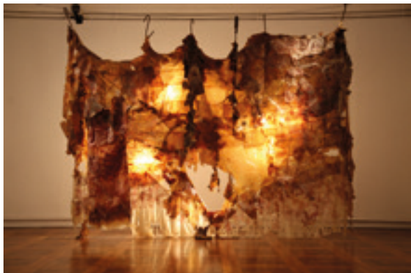
Figura 5. Helena Kanaan, Impressões, acúmulos e rasgos , 2011/16, instalação com aguada litográfica e látex, 180 x 300cm. Exposição Expressões do Múltiplo . Pinacoteca Barão de Santo Ângelo, IA/UFGRS, 2017. Foto: Giordana Winkler.

Na performance de Carla Borba, encontramos quase um apelo a manter o equilíbrio pela respiração. Em Espaço de conflito , que evoca o frágil momento vivido no Brasil, a artista insufla balões coloridos e convida o público a fazer o mesmo 18 . Os balões enchidos são deixados na galeria e, progressivamente, a ocupam deixando os traços da performance, resultando uma instalação em constante mobilidade (fig. 4).