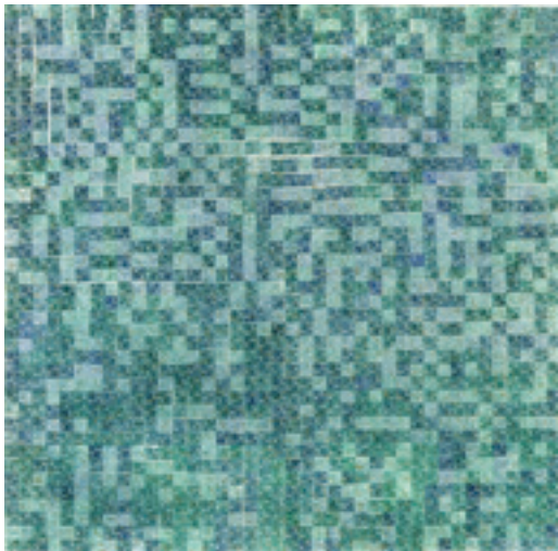
Figura 3. Maria Lucia Cattani, green 1,600 , 1998, guache sobre papel, 124 x 124 cm.

Editou-se uma publicação homônima, e a exposição foi aberta em meio à realização do 25º Encontro Nacional da Associação Nacional de Pesquisadores em Artes Plásticas (ANPAP), e ao ocorrer na UFRGS, desfrutou de um público especializado adicional.