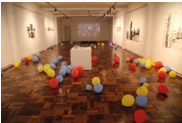
Figura 4. Vista parcial da exposição Expressões do Múltiplo . Pinacoteca Barão de Santo Ângelo, IA/UFRGS, 2017.

Com uma abordagem bem diferenciada, Roseli Nery também recria mundos. Suas Colônias são constituídas por diminutos objetos industrializados. Comumente do universo feminino, e encontrados em armarinhos, estes objetos, que em seus empregos usuais geralmente passam despercebidos, aqui adquirem uma singularidade forjada pelo arranjo e acúmulo.