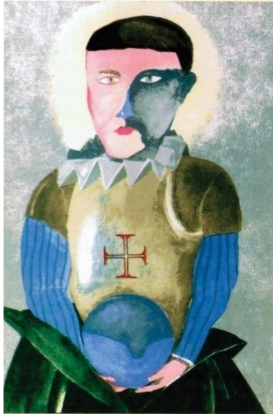
Fig. 1 – Ilustração de capa - Mário Botas (FARIA, 1993, [s. p.] )

E nessa tentativa de sutil convencimento, até o pequeno ready-made colocado sobre o berço do (duplo) infante, ao qual Sebastião devia as “viagens por mares imaginários, sobrevoados por peixes voadores e percorridos por extravagantes bichos” (FARIA, 1993, p. 25), servem-lhe para criar, diante de nós, uma realidade de mares e conquistas, tão naturais à História sebástica. Aliás, os sonhos de Sebastião não eram outra coisa senão sonhos de guerras e turbantes, de mouras perseguições. As brincadeiras, sempre condicionadas à nobreza: brincar de falar várias línguas, papear com duques, condes, marqueses, brincar de ser nobre, de ser o que não se é. Vários outros exemplos, a estes, ainda poderiam ser arrolados, como o do igualmente mítico surgimento de sua voz, que não por acaso se dá próximo ao Pentecostes, e o da Ave branca – Espírito Santo? –, diferente de tudo o que seus pais já haviam visto, e que sobrevoara a casa materna na mesma ocasião do aparecimento de sua voz. Semelhanças e eventos estes, todos fontes de dúvidas e questionamentos do Sebastião ficcional acerca de si.