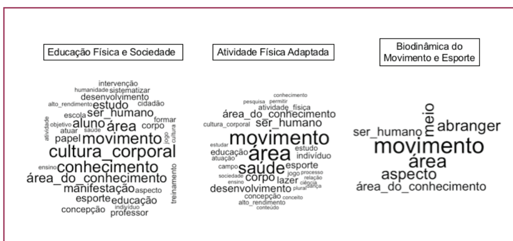
Figura 3 - Nuvens de palavras comparativas entre áreas

Com isso, temos a possibilidade de diferenciar as análises por área de concentração. Com a finalidade de traçar um comparativo entre as três áreas, apresentamos as nuvens de palavras desvelando os conceitos centrais e mais representativos por área de concentração.