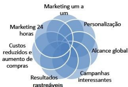
Figura 1 - Representação de conceitos do marketing digital

As implementações advindas das tecnologias de informação e comunicação (TIC) como estratégia de marketing digital geram oportunidades de crescimento organizacional afinal, os agentes mudaram os perfis tradicionais com elevadas expectativas em relação à comunicação com as instituições. Na Figura 1, verifica-se que Strauss e Frost (2012) apontam, segundo uma pesquisa feita no Reino Unido através do website governamental BusinessLuk , as oportunidades e mudanças do “novo marketing”.