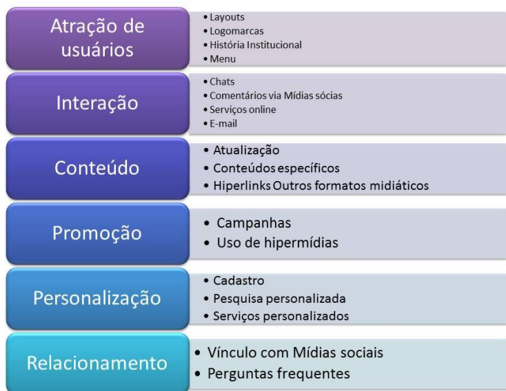
Figura 2 - Subcategorias dos indicadores de marketing digital