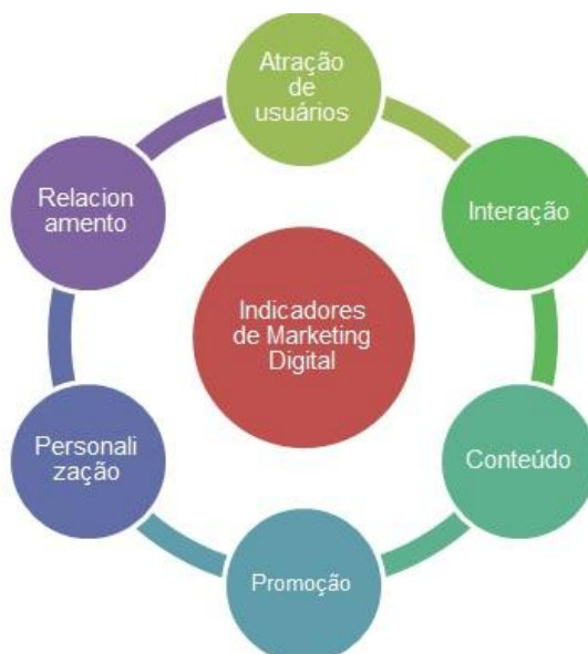
Figura 2 - Indicadores de marketing digital para ambientes arquivísticos

Para o levantamento de dados, foram enumerados os arquivos em uma planilha de endereços eletrônicos e nome da instituição. A partir desse momento, sentiu-se a necessidade de indicadores que poderiam nortear a coleta de dados nos websites . Portanto, em um primeiro momento, apoiou-se em pesquisa bibliográfica para realizar a descrição de indicadores que pudessem determinar diretrizes para a análise dos websites dos arquivos no que se refere ao marketing digital, apreendido nos conceitos propostos por Chleba (1999); Zeisser e Waitman (1998); Strauss e Frost (2012); e Menezes (2013).