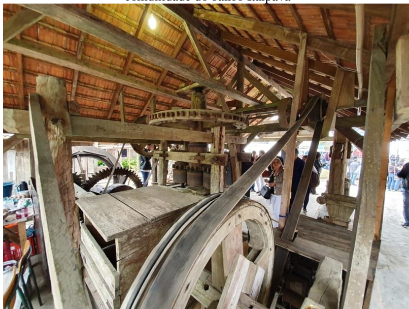
Figura 5 – O saber fazer do engenho de farinha na construção da memória coletiva junto à comunidade do bairro Itaipava