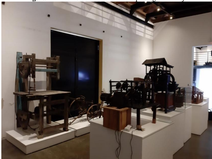
Figura 4 – Acervo do Museu Etno-Arqueológico de Itajaí

comunidade rural do bairro Itaipava, para registro das memórias e do seu saber fazer.