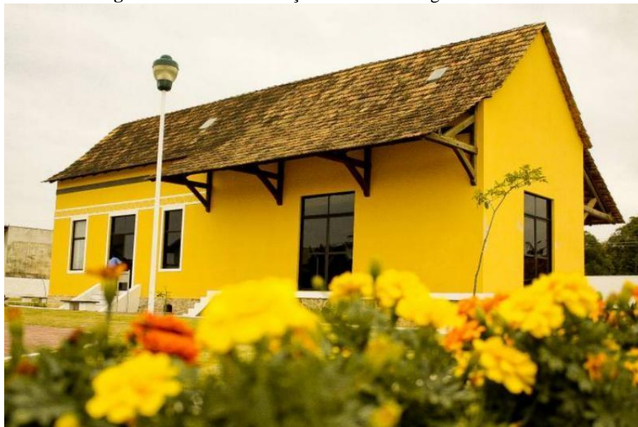
Figura 2 – Prédio da Estação Ferroviária Engenheiro Vereza