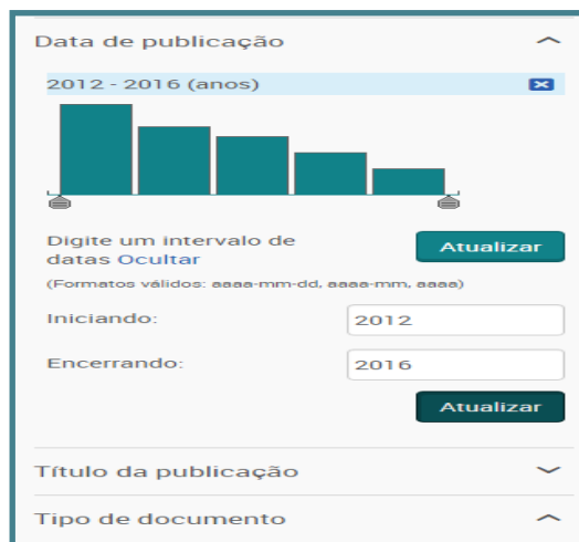
Figura 1 - Distribuição dos registros da produção de artigos na base de dados LISA que utilizaram o termo “Sociedade da Informação” na área de CI

Na base de dados LISA, foram encontrados 85 artigos que utilizaram a expressão “sociedade da informação”.