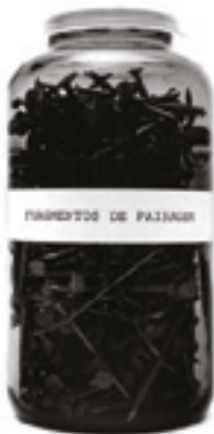
Figura 10. Carlos Zilio. Fragmentos de paisagem (1974) Vidro e pregos.