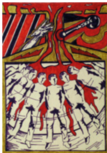
Figura 6. Carlos Zilio. Fixação . 1970. Caneta hidrográfica sobre papel.

Tinha uma coisa política, tinha essa coisa com a vida. Com a vida e com a materialidade da vida. Porque pegavam coisas, colavam, era muito direta.