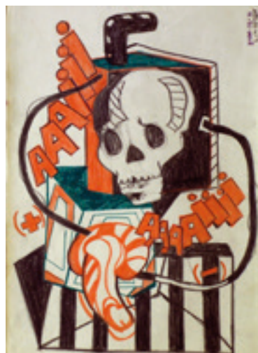
Figura 2. Carlos Zilio. Estudo N° 9, PE. Abril de 1970. Lápis de cor sobre papel.