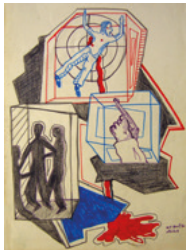
Figura 1. Carlos Zilio. HCE. Estudo N° 6. Abril de 1970. Lápis de cor sobre papel.

Pensava isso. Mas depois, quando eu saí da cadeia, eu vi que aquilo era aquilo mesmo. Experiência. Mesmo que estivesse sozinho – eu passei um tempo sozinho, passei uns três ou quatro meses sozinho –, eu trabalhei o tempo inteiro.