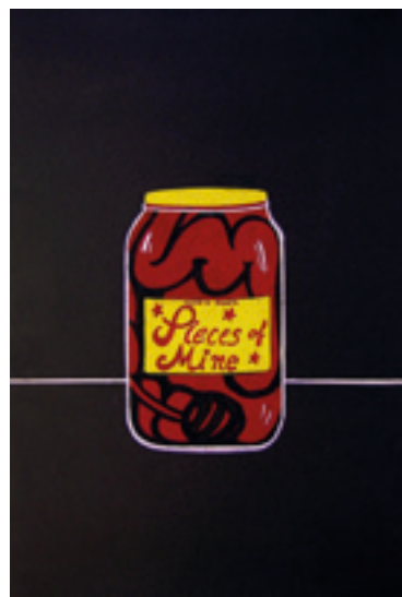
Figura 9. Carlos Zilio. Pieces of mine (1971) Guache sobre papel.