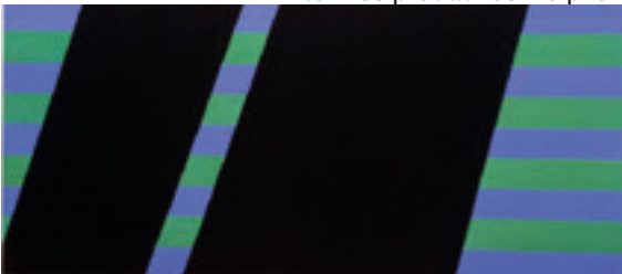
Figura 14. Carlos Zílio. Tentativa de ver o balcão através da janela e do portão (1983). Acrílica sobre tela.

Hoje em dia a arte virou outra coisa. Diferente, mas de uma certa maneira consequência daquilo que eu vivi. Nós éramos os iconoclastas. Mas tudo bem. A arte tomou outra dimensão, outras linguagens, outras possibilidades, em um mundo diversificado e com muitas possibilidades. Quando eu retomei a pintura, sentia que estava fazendo uma coisa que não tinha nenhuma caução, nenhuma garantia institucional nem pública naquele momento. A ideologia era a da morte da pintura. Isso durante uns dez anos, viveu-se isso fortemente. Depois a pintura reaparece com força e se diversifica. Eu acho que a pintura é, neste novo campo da arte, o suporte específico que permite o exercício da história. Isso é o que me interessa.