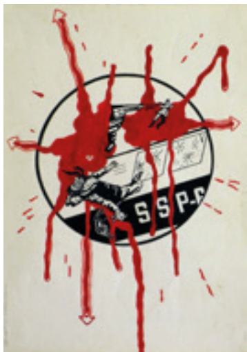
Figura 4. Carlos Zílio. Zé , Agosto de 1970. Caneta hidrográfica sobre papel. Foto: Carlos Zílio.

Tinha sim, mas os trabalhos que fiz, nas quatro exposições: Opinião 66, Salão de Brasília, a Bienal de São Paulo, de 67, e na Nova Objetividade, eram objetos. Alguns se perderam. Quando eu recomeço a desenhar, minha referência era essa, mas agora eram desenhos. Há uma retomada, digamos assim, da linguagem, mas com outras características, era mais narrativa, era mais biográfica, coisa que no período anterior não existia.