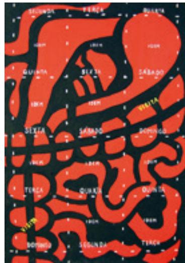
Figura 8. Carlos Zilio. Rotina dilacerante (1971) Guache sobre papel.

Em relação à questão da pintura, já no final dos anos 70, no período em que você esteve na França, de 1976 a 1980, você fez esse movimento mesmo de retomar a pintura. E você fala muito do seu contato com Cézanne e Rubens. Minha curiosidade é em relação ao Rubens. Por que Rubens?