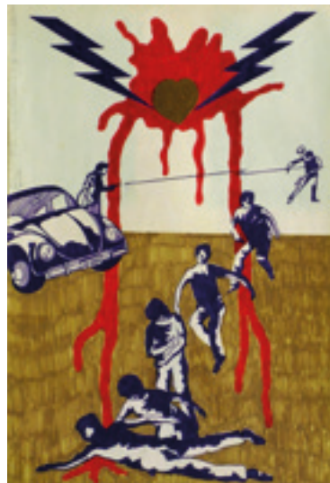
Figura 5. Carlos Zilio. A queda . Dezembro de 1970. Caneta hidrográfica sobre papel.

Eu acredito nisso, que houve uma influência da Nova Figuração Argentina. Não sei se sobre todos da minha geração aqui no Rio, mas o [Rubens] Gerchman dizia isso. O Gerchman era amigo do Luis Felipe Noé e, quando eu falei com o Noé, ele disse que o Gerchman havia falado isso para ele. No meu caso específico, a exposição que eles fizeram no MAM, que era uma exposição grande, com trabalhos grandes, quer dizer, grande para a época, pois a escala era a do bloco do MAM/RJ, o prédio principal ainda era um esqueleto de concreto, uma estrutura. A exposição foi muito importante porque foi a primeira manifestação de arte que eu vi que fugia dos elementos da tradição pictórica. Era o que na época nós chamávamos de anti-arte, retomava algumas linguagens figurativas em outros moldes, tinha essa coisa da assemblage , era uma coisa mais ligada à vida. A colagem em uma outra figuração, com um tipo de material que eles usavam, mais industrial.