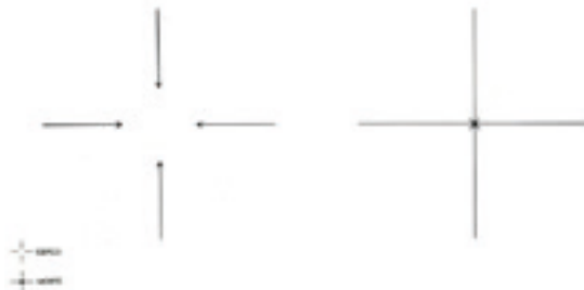
Figura 11. Carlos Zilio. Cerco-morte (1974). Acrílica sobre tela.

Falei numa boa pro cara. Essa visão de utopia, de coisa a ser construída, era concreta. Não era subjetividade não. Era o que permitia que a gente fizesse aquelas loucuras todas sem ter nada de concreto, a não ser a ideologia. Então, quando eu saio da cadeia, já saio com a visão de que aquilo tinha sido derrotado. Mas poderia ser uma derrota de uma linha política e não dos fundamentos políticos. Mas a década de 70, os anos de 60 para 70 têm umas coisas interessantes. Você tem uma coisa que era muito presente, que era a Guerra no Vietnã. A guerra era uma coisa muito invasiva, quer pelo espaço que ocupava na imprensa, quer por ser a primeira e última guerra transmitida ao vivo. Os americanos aprenderam com aquilo. Depois, na Guerra no Iraque, eles fizeram a reportagem da ocupação – a guerra do Star Wars . Aquele negócio da Guerra do Vietnã, da mãe americana vendo televisão e de repente vê, por acaso, o