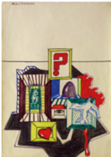
Figura 3. Carlos Zílio. Estudo Nº 8 , HCE. Abril de 1970. Lápis de cor sobre papel.