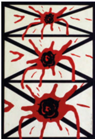
Figura 7. Carlos Zilio. A quase partida (1971) Caneta hidrográfica sobre papel. Foto: Carlos Zilio.

Na cadeia, o que eu tinha era a memória, eu não tinha mais a influência do presente, então o que eu fazia era recuperar aquele instrumental passado e adaptar àquela minha nova narrativa específica. Era menos política no sentido dos meus trabalhos sobre política e alienação. Era sobre a experiência que eu estava vivendo. Mas a linguagem era própria da propaganda. A cor chapada, a possibilidade de comunicação e de reprodutibilidade, que eram as preocupações que a gente tinha. Acho que esses eram os dois pilares em comum: a comunicação e a reprodutibilidade. Enfim, acho que isso foi exercido por todos nós, mas, na verdade, nunca ninguém fez nada em termos de tiragem, mas havia o potencial disso. Essas duas coisas, quando você coloca um terceiro elemento, que é a política, podem remeter aos construtivistas russos, mas, no nosso caso, a referência mais imediata era um sentimento pop, não propriamente à Pop Art, que a gente conhecia pouco.