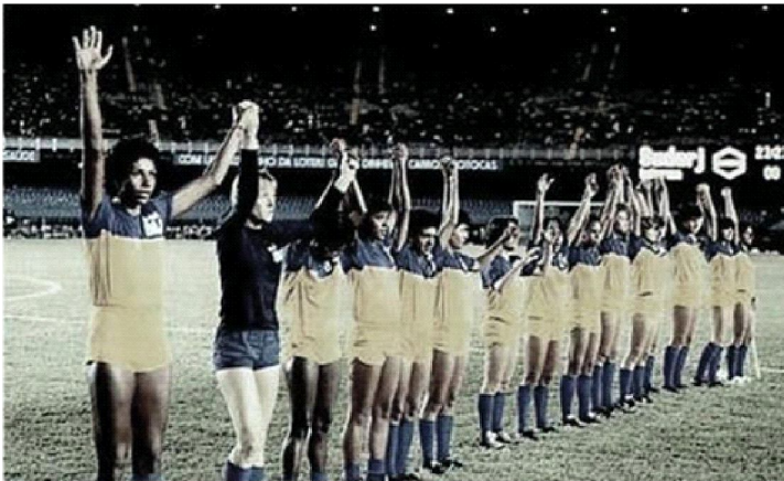
Figura 4 - Equipe do Esporte Clube Radar

Mesmo com o atraso da divulgação da liberação da prática do futebol feminino no Brasil pelos meios de comunicação, a popularização da modalidade e especialmente a fundação e desempenho da equipe do Esporte Clube Radar - ilustrada na sequencia-, promoveram a divulgação de matérias a respeito do futebol feminino.