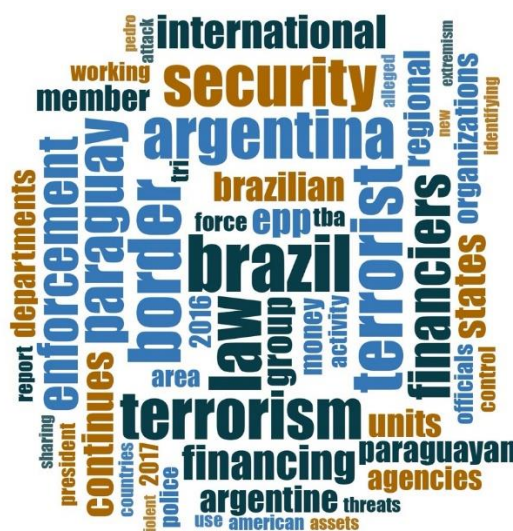
Quadro 1 – As 100 palavras mais frequentes nos Country Reports on Terrorism entre os anos de publicação de 2017 a 2020

Na segunda etapa da análise, inserimos no software NVivo os quatro recortes que tratam especificamente do Brasil, da Argentina e do Paraguai nos Country Reports on Terrorism referentes aos anos de 2016 a 2019, publicados nos anos imediatamente posteriores. O período abrange todo o mandato de Donald Trump à frente da Casa Branca. Realizou-se uma busca das 100 palavras mais frequentes com três letras ou mais em cada recorte referente a cada ano e também uma busca nos quatro recortes juntos a fim de estabelecer o total geral do período Trump. Nesta última busca, que pode ser observada no Quadro 1 e na Tabela 1, abaixo, os dez vocábulos mais encontrados foram, respectivamente: “Brazil” (122 menções), “security” (segurança, 106), “law” (lei, 105), “terrorism” (terrorismo, 103), “Argentina”(101), “terrorist” (terrorista, 100), “Paraguay” (94), “border” (fronteira, 93), “enforcement” 3 (aplicação/cumprimento, 84) e “financial” (financeiro, 82).